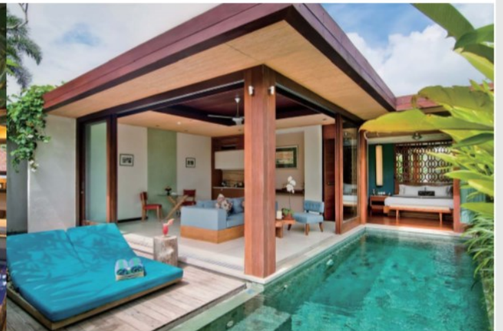
■ MACA VILLAS & SPA BALI ■ インドネシア・バリ島