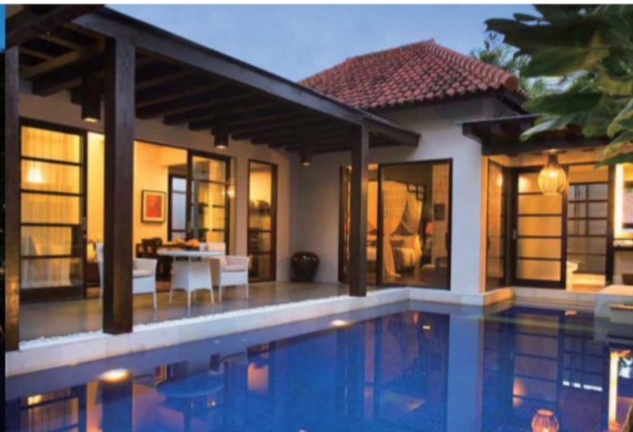
■ Alaya Dedaun Kuta ■ インドネシア・バリ島