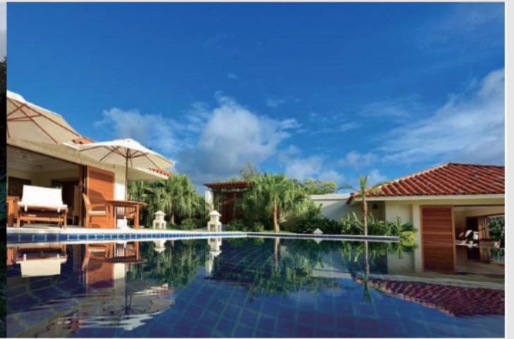
■ ザ・プセナテラス ■ 沖縄県・名護市