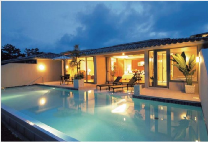
■ JUSANDI ■ 沖縄県・石垣島