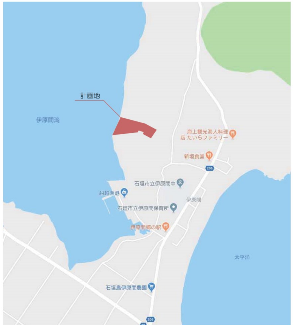
沖縄県石垣島伊原間