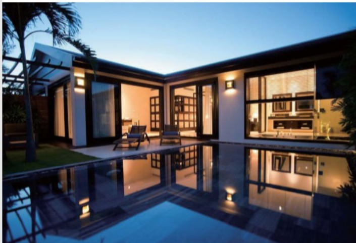
■ Fusion Maia Danang ■ ベトナム・ダナン