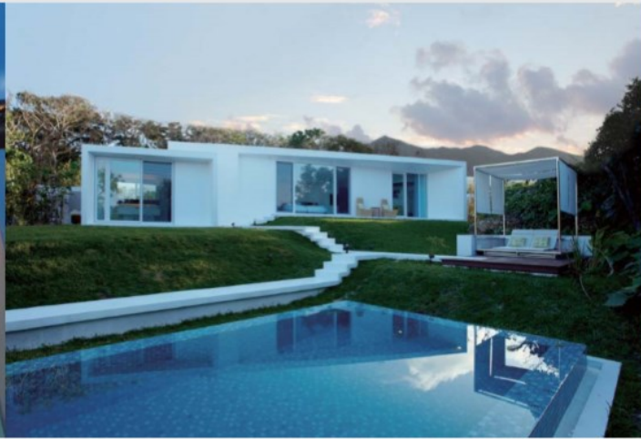
■ オリエンタルヒルズ沖縄 ■ 沖縄県・国頭郡恩納村